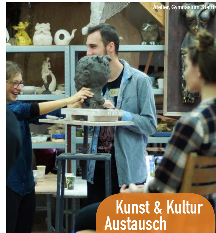
Atelier, Gymnasium Stettin